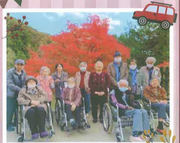
♡綺麗な紅葉にも負けない美男美女たち♡