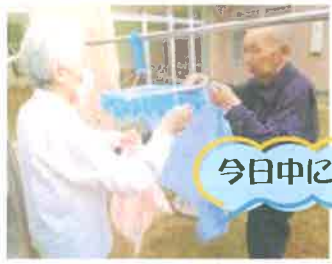
生活運動の一つの洗濯干し